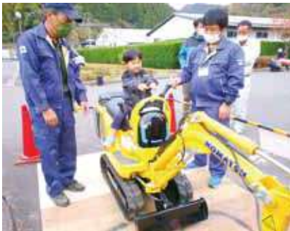
ミニ重機操作体験（チップすくい）

令和4年10月30日、日南町林業まつりを開催しました。当日は、「にちなん食のバザール」、「にちなんお仕事フェア」が同時開催され、たくさんの方々にご来場いただきました。伐木チャンピオンシップ（丸太の合わせ切り）やミニ重機操作体験、薪割り体験、木工体験、林業士体験等、3年ぶりの開催でしたが大盛況となりました。ありがとうございました。