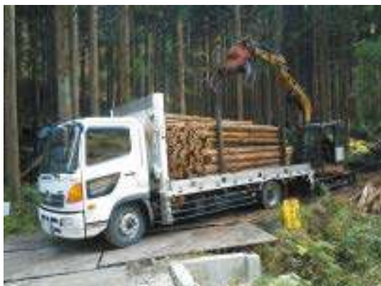
トラック積込作業