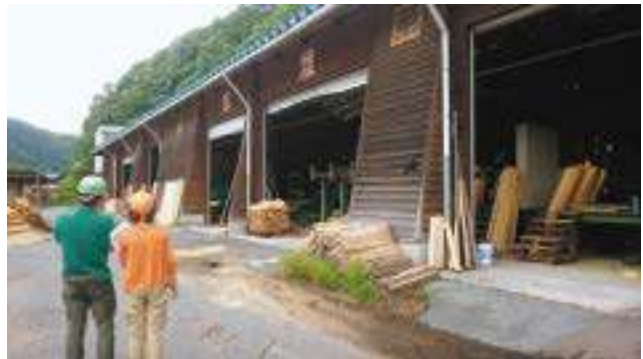
ウッドカンパニーニチナンの審査

8月21・22日、FSC FM認証（森林管理）年次審査でした。昨年からの指摘事項の書類審査や、現地確認が行われました。